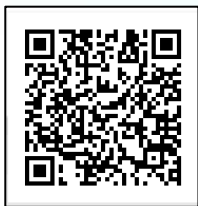
申込用二次元コード